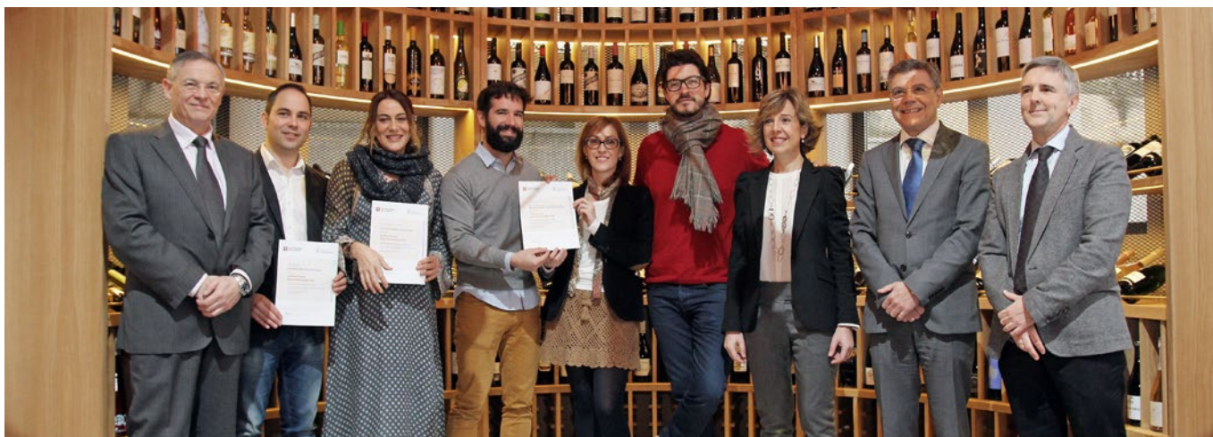
Todos los galardonados en los Premios al Mejor Emprendedor 2014.

La Cátedra de Emprendedores de la Cámara Oficial de Comercio e Industria y CaixaBank en la Universidad de La Rioja concedieron el Premio al Mejor Emprendedor 2014 al wine bar y restaurante Wine Fandango; y los accésit, a Pan Blanco y Pan de Lino y NetSite Services.