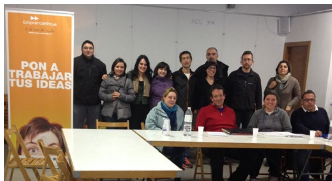
Taller de motivación desarrollado en Torrecilla en Cameros.

Por otro lado, el Ayuntamiento de Alfaro acogió un taller sobre exportación destinado a presentar el proyecto EmprendeRioja a los emprendedores de la comarca. Durante el mismo, se informó a los asistentes sobre todos los servicios y apoyos que les ofrece el plan a la hora de crear una empresa y de iniciar un proceso de apertura a los mercados exteriores.