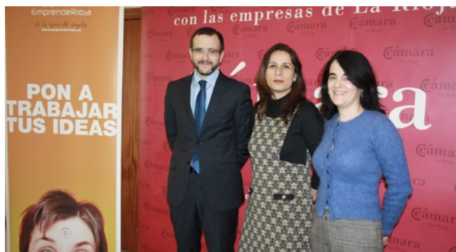
El salón de actos de la Cámara acogió el taller grupal sobre mutuas.