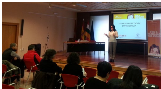
Taller sobre exportación en Alfaro.