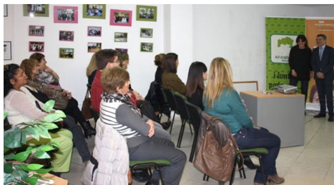
Taller de motivación celebrado en la sede de Afammer.